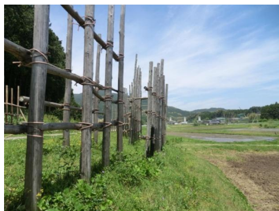
馬防柵 (上)、信玄塚 (下)

【アクセス方法】 JR 飯田線三河東郷駅下車 徒歩 15 分 東名高速道路豊川 IC より 35 分