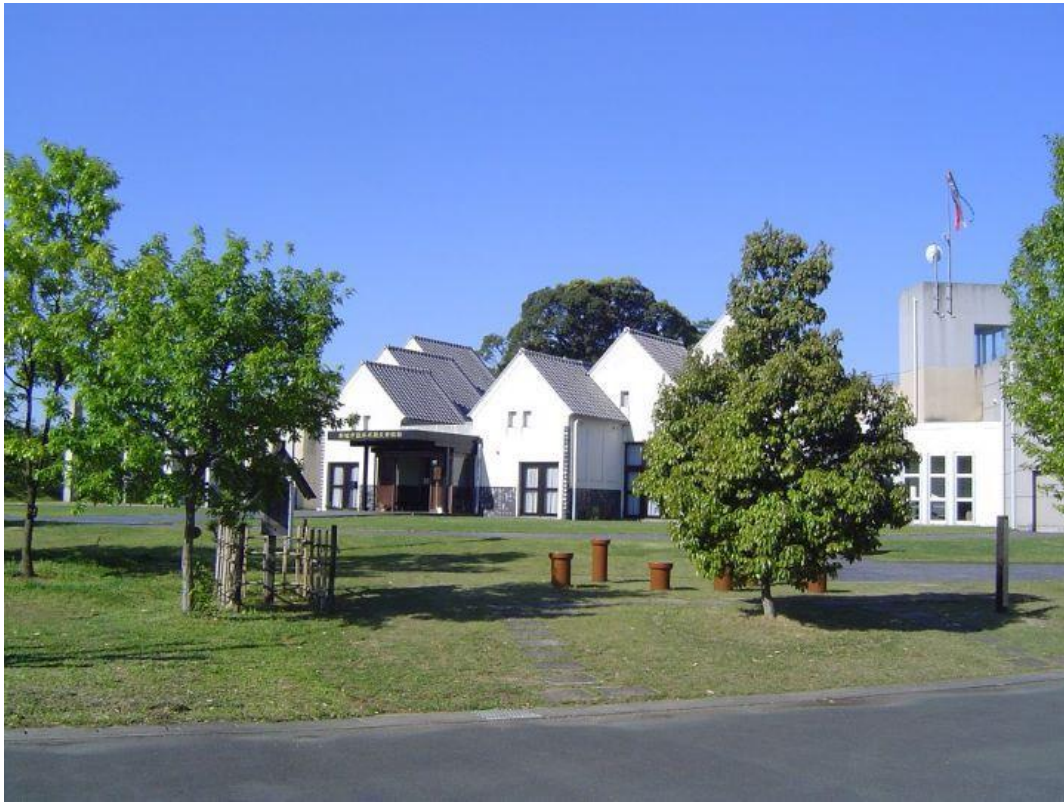
新城市設楽原歴史資料館

新城市設楽原歴史資料館は、戦国時代に新城市で行われた【長篠・設楽原の戦い】を紹介する資料館として平成 8 年 4 月に開館いたしました。設楽原を訪れる多くの見学者を案内する地域の方々から、その活動の拠点をとという声が多数あり、現在でもそうした地域の方々に支えられて資料館は運営されています。当時、すでに隣町の鳳来町（平成 17 年に新城市合併）には長篠城址史跡保存館がありました。長篠城址史跡保存館は長篠城を巡る攻防を紹介し、設楽原歴史資料館は設楽原で行われた決戦を紹介するという棲み分けを開館当初より行っており、市町村の枠を超えて連携を強化してきました。現在、設楽原歴史資料館では【長篠・設楽原の戦い】だけではなく、火縄銃をはじめとした数多くの古式銃を所蔵、展示しております。日本の古式銃を専門に扱う資料館として、古式銃の手入れなども積極的に行っています。